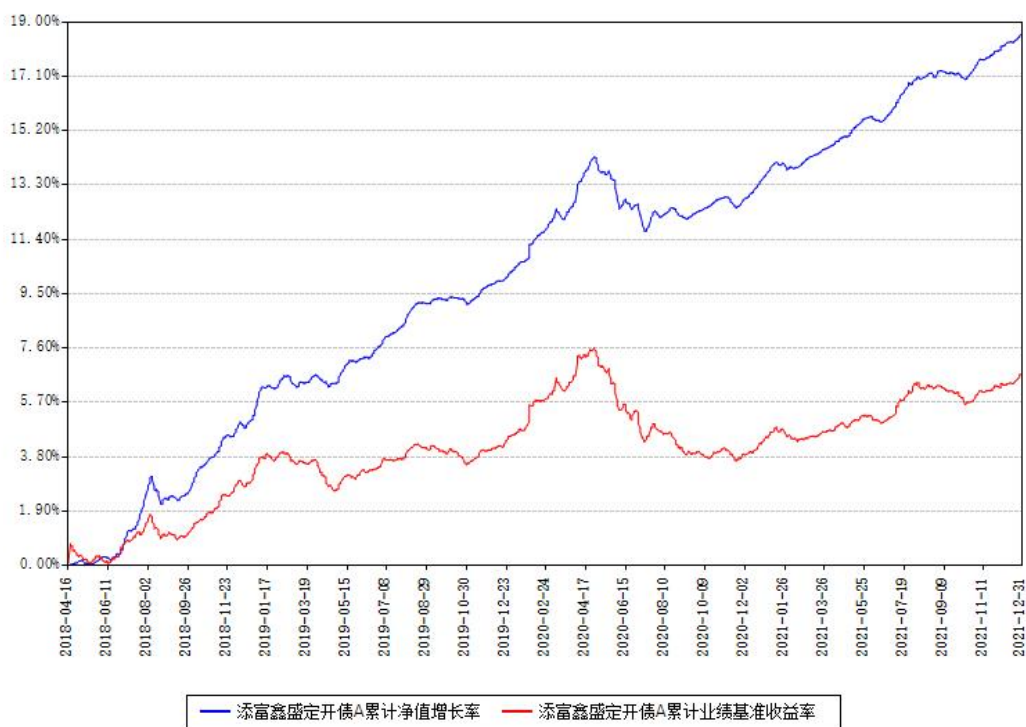
添富鑫盛定开债A累计净值增长率与同期业绩基准收益率对比图