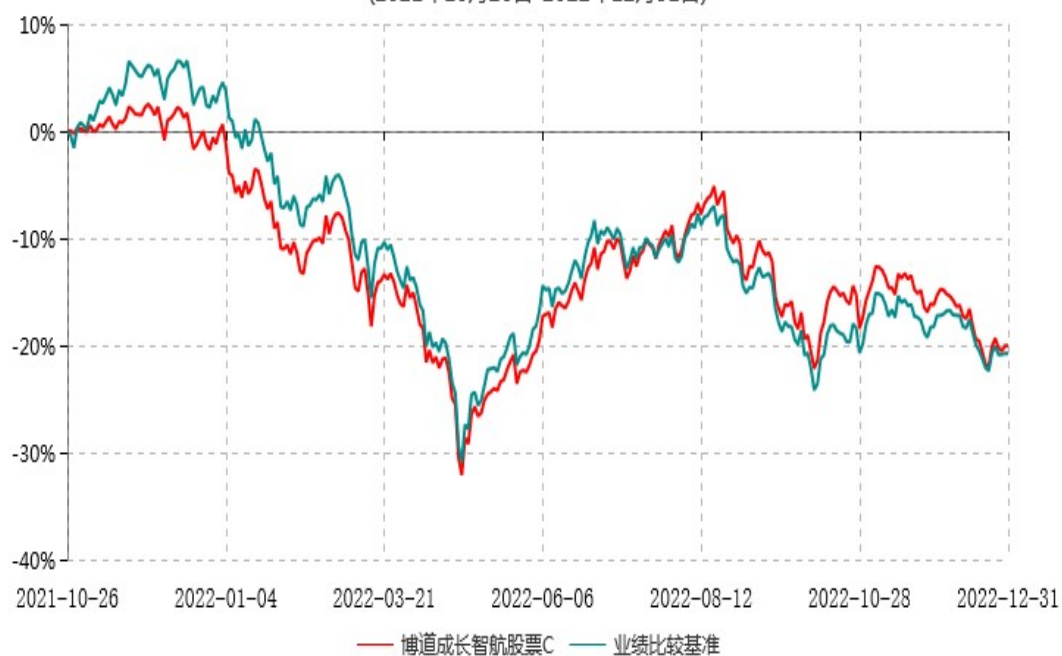
博道成长智航股票C累计净值增长率与业绩比较基准收益率历史走势对比图 (2021年10月26日-2022年12月31日)

注：本基金基金合同生效日为2021年10月26日，建仓期为自基金合同生效日起的6个月。截至报告期期末，本基金已完成建仓但报告期期末距建仓结束未满一年。截至建仓期结束，本基金各项资产配置比例符合基金合同及招募说明书有关投资比例的约定。