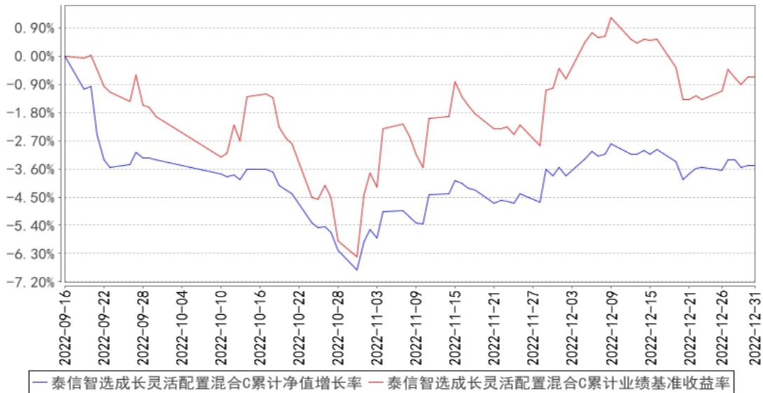
泰信智选成长灵活配置混合C累计净值增长率与同期业绩比较基准收益率的历史走势对比图