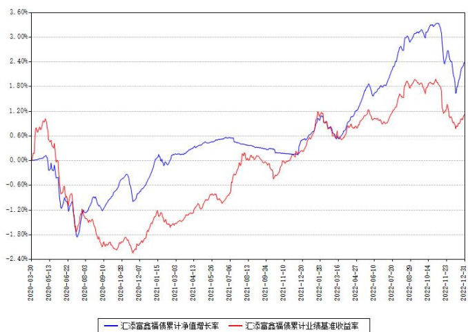
汇添富鑫福债券累计净值增长率与同期业绩基准收益率对比图