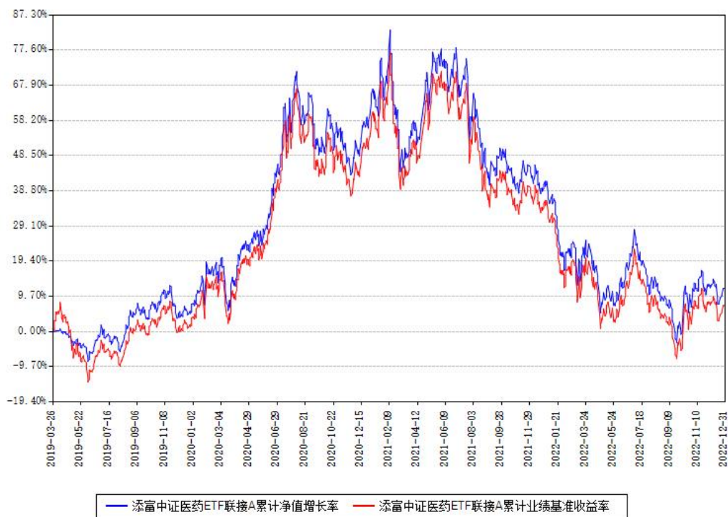
添富中证医药ETF联接A累计净值增长率与同期业绩基准收益率对比图