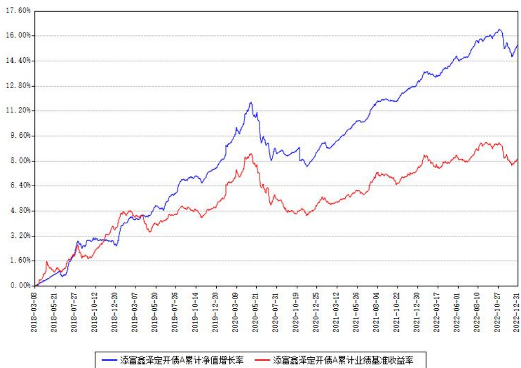
添富鑫泽定开债A累计净值增长率与同期业绩基准收益率对比图