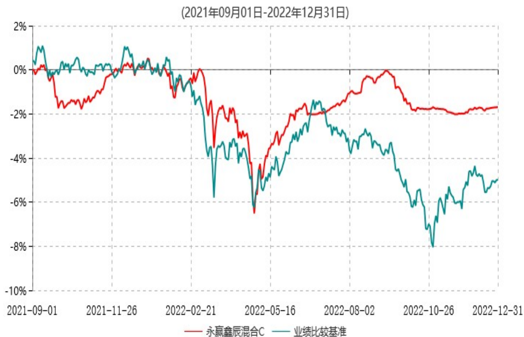
永赢鑫辰混合C累计净值增长率与业绩比较基准收益率历史走势对比图