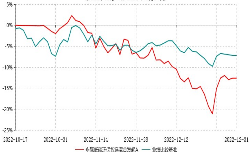
永赢低碳环保智选混合发起A累计净值增长率与业绩比较基准收益率历史走势对比图 (2022年10月17日-2022年12月31日)

注：1、本基金合同生效日为2022年10月17日，截至本报告期末本基金合同生效未满一年； 2、本基金建仓期为本基金合同生效日起六个月，截至本报告期末，本基金尚处于建仓期中。