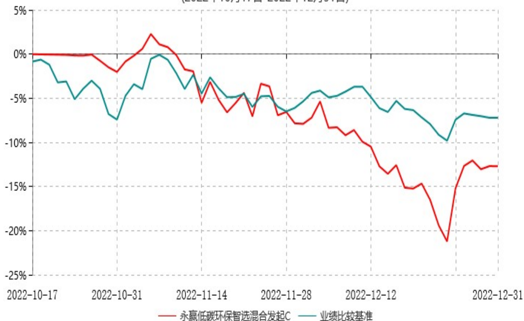
永赢低碳环保智选混合发起C累计净值增长率与业绩比较基准收益率历史走势对比图 (2022年10月17日-2022年12月31日)

注：1、本基金合同生效日为2022年10月17日，截至本报告期末本基金合同生效未满一年； 2、本基金建仓期为本基金合同生效日起六个月，截至本报告期末，本基金尚处于建仓期中。