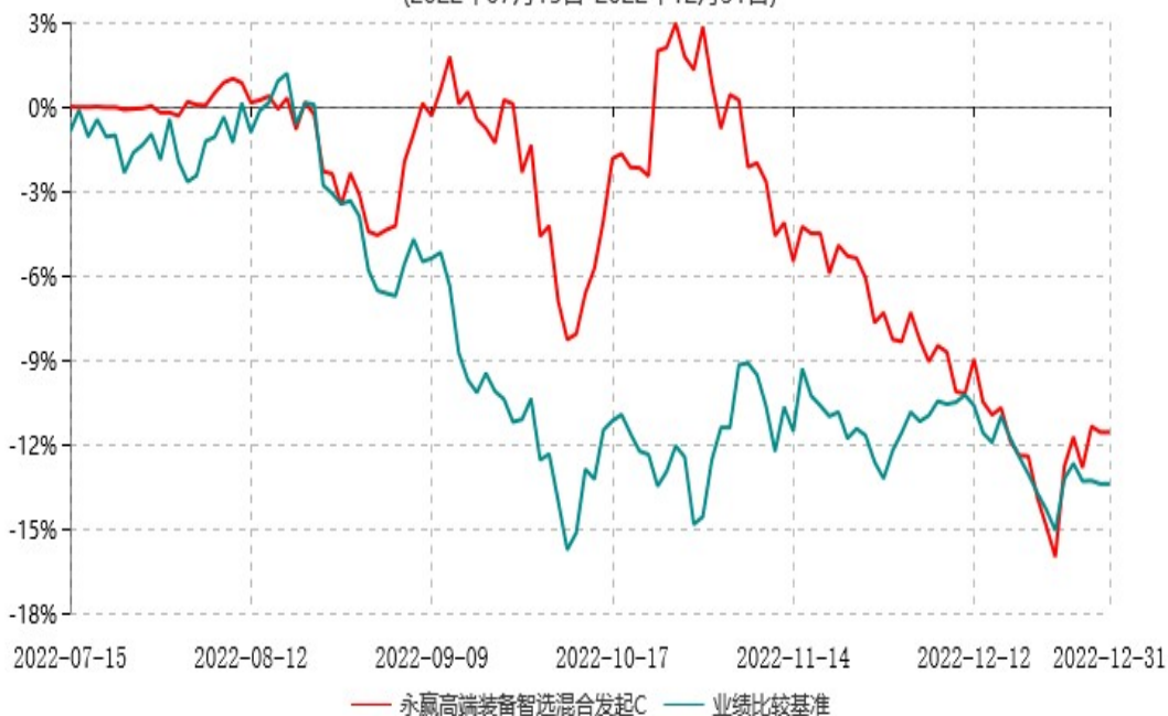
永赢高端装备智选混合发起C累计净值增长率与业绩比较基准收益率历史走势对比图 (2022年07月15日-2022年12月31日)