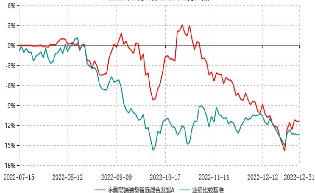
永赢高端装备智选混合发起A累计净值增长率与业绩比较基准收益率历史走势对比图 (2022年07月15日-2022年12月31日)