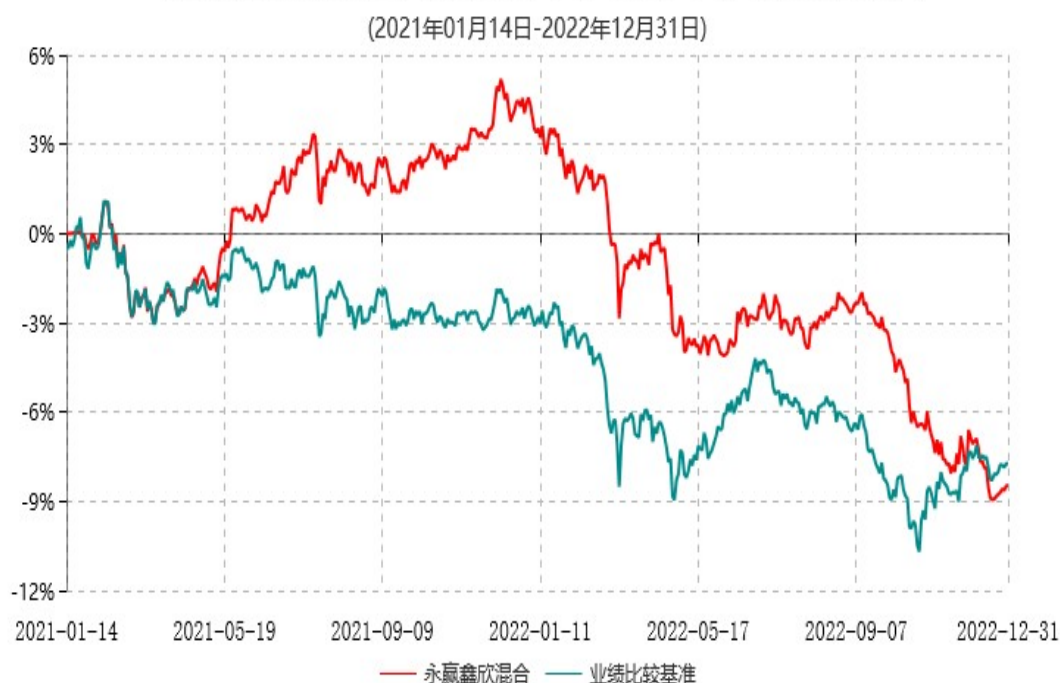
永赢鑫欣混合型证券投资基金累计净值增长率与业绩比较基准收益率历史走势对比图