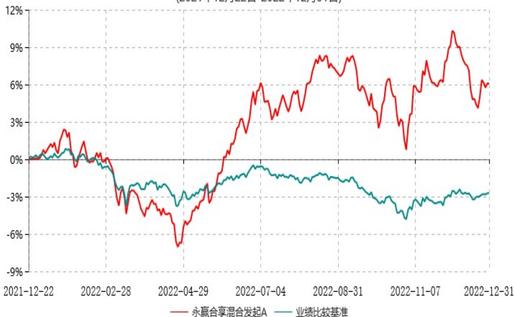
永赢合享混合发起A累计净值增长率与业绩比较基准收益率历史走势对比图 (2021年12月22日-2022年12月31日)