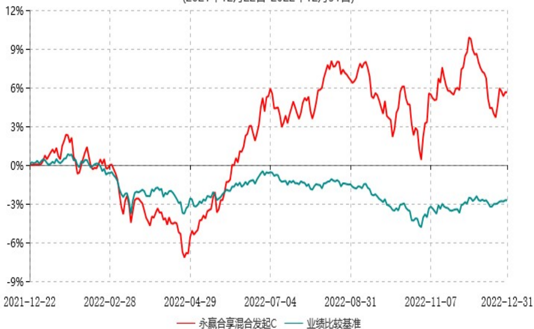
永赢合享混合发起C累计净值增长率与业绩比较基准收益率历史走势对比图 (2021年12月22日-2022年12月31日)