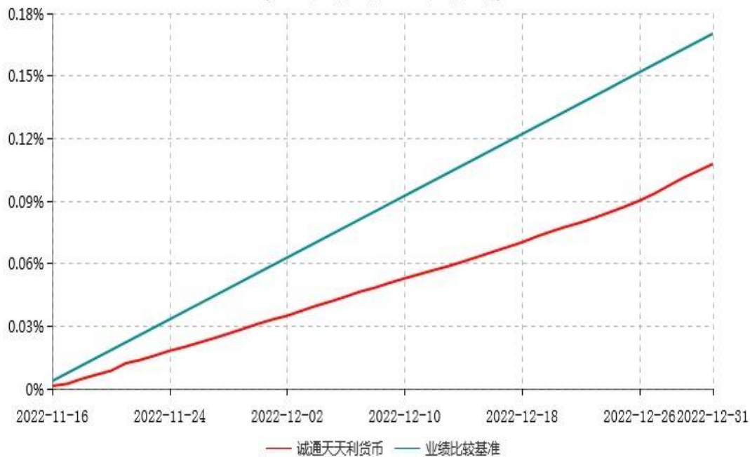
诚通天天利货币型集合资产管理计划累计净值收益率与业绩比较基准收益率历史走势对比图 (2022年11月16日-2022年12月31日)