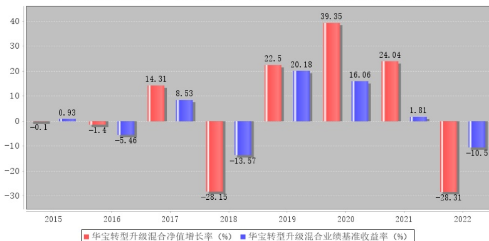
华宝转型升级混合每年净值增长率与同期业绩比较基准收益率的对比图