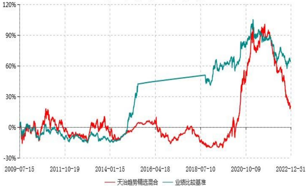
天治趋势精选灵活配置混合型证券投资基金累计净值增长率与业绩比较基准收益率历史走势对比图 (2009年07月15日-2022年12月31日)