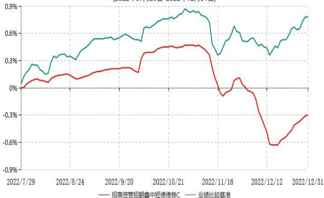
招商资管招朝鑫中短债债券C累计净值增长率与业绩比较基准收益率历史走势对比图 (2022年07月29日-2022年12月31日)

注：（1）本集合计划合同于2022年07月29日生效，截至本报告期末不满一年；（2）按集合计划合同和招募说明书的约定，基金管理人应当自集合计划合同生效之日起6个月内使集合计划的投资组合比例符合本集合计划合同的有关约定。本报告期本集合计划处于建仓期内。