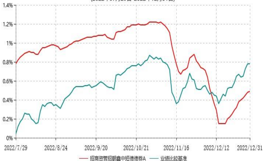
招商资管招朝鑫中短债债券A累计净值增长率与业绩比较基准收益率历史走势对比图 (2022年07月29日-2022年12月31日)

注：（1）本集合计划合同于2022年07月29日生效，截至本报告期末不满一年；（2）按集合计划合同和招募说明书的约定，基金管理人应当自集合计划合同生效之日起6个月内使集合计划的投资组合比例符合本集合计划合同的有关约定。本报告期本集合计划处于建仓期内。