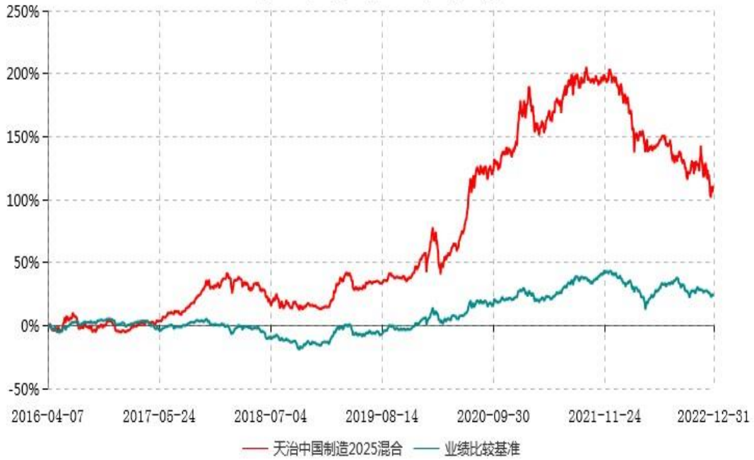
天治中国制造2025灵活配置混合型证券投资基金累计净值增长率与业绩比较基准收益率历史走势对比图 (2016年04月07日-2022年12月31日)