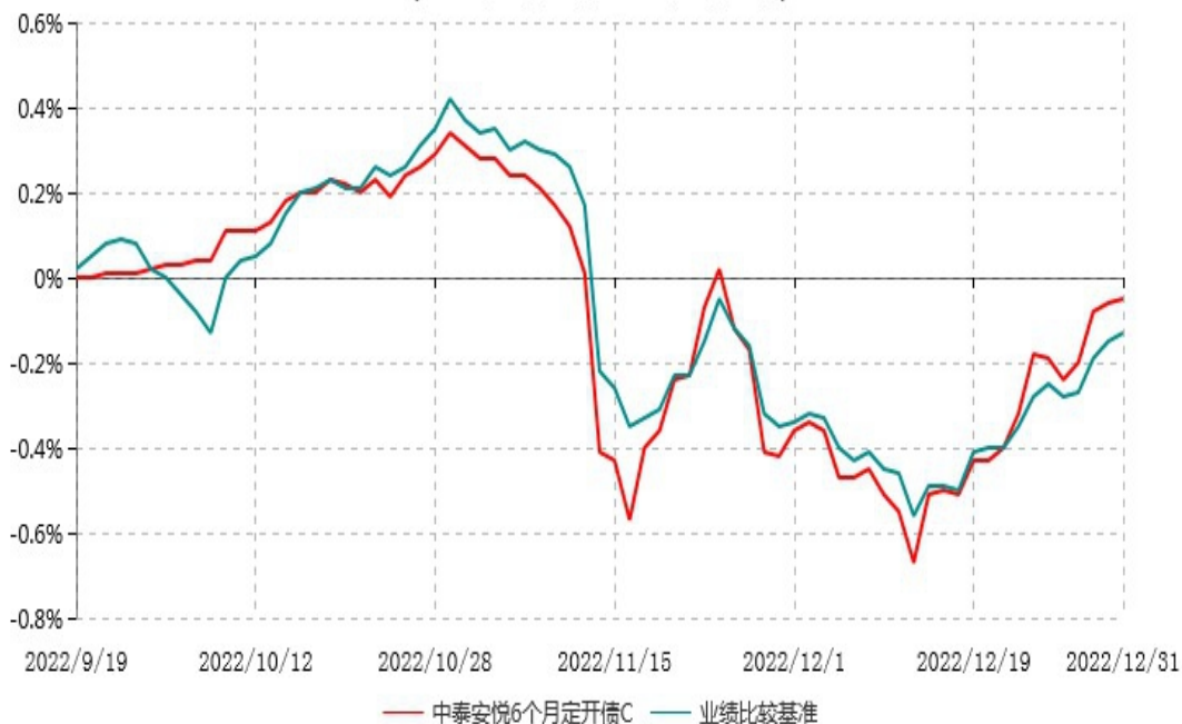
中泰安悦6个月定开债C累计净值增长率与业绩比较基准收益率历史走势对比图 (2022年09月19日-2022年12月31日)