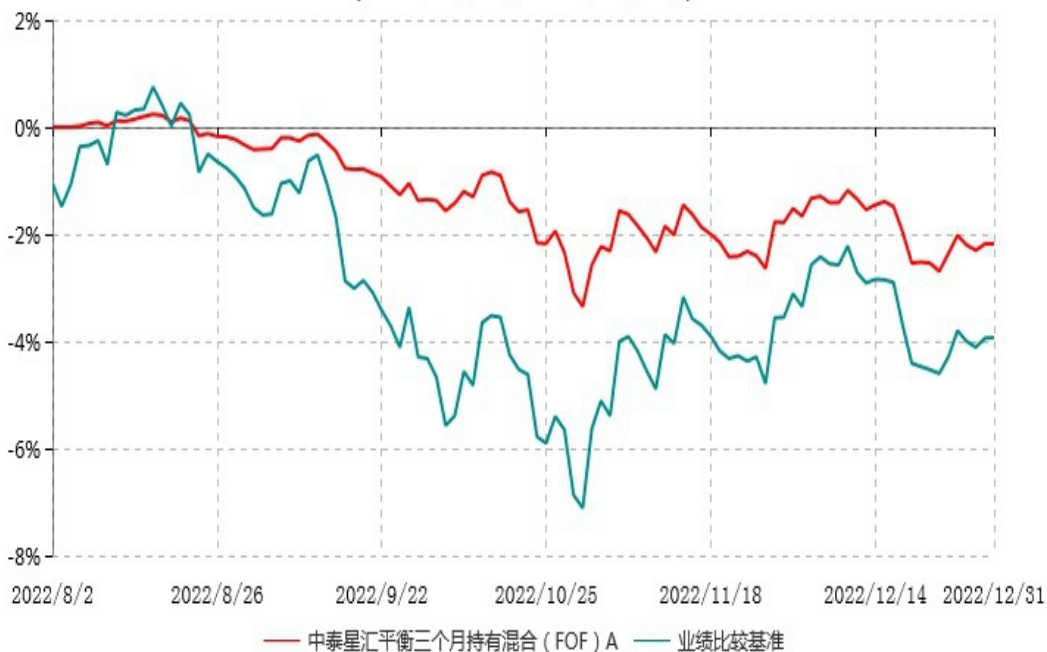
中泰星汇平衡三个月持有混合（FOF）A累计净值增长率与业绩比较基准收益率历史走势对比图 (2022年08月02日-2022年12月31日)