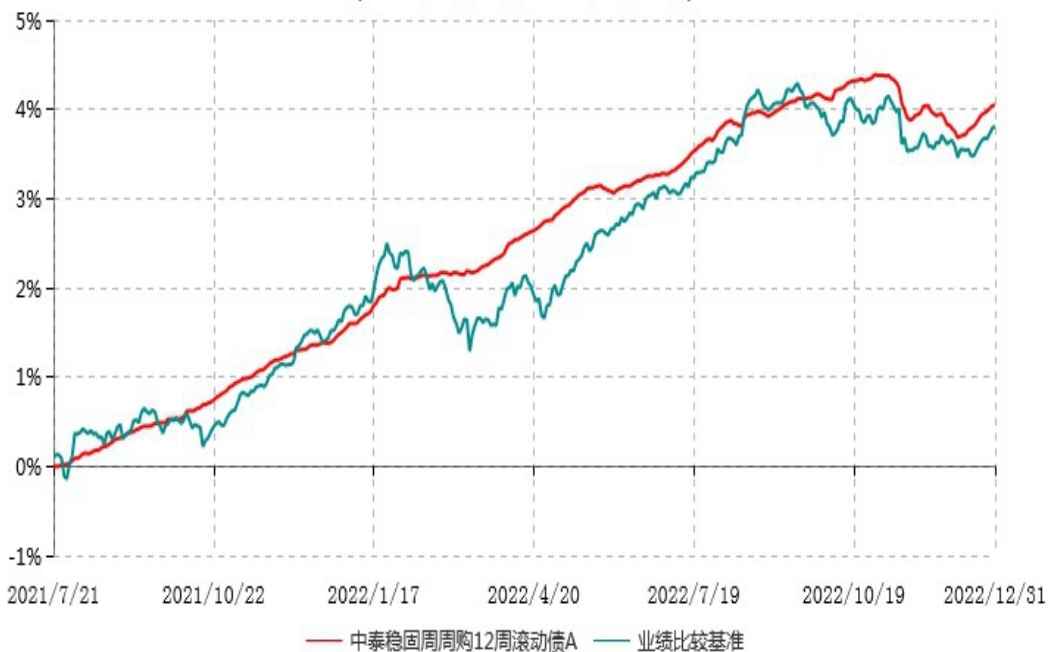
中泰稳固周周购12周滚动债A累计净值增长率与业绩比较基准收益率历史走势对比图 (2021年07月21日-2022年12月31日)

注：根据基金合同约定，本基金自基金合同生效之日起6个月内为建仓期。建仓期结束时，本基金各项资产配置比例符合基金合同约定。