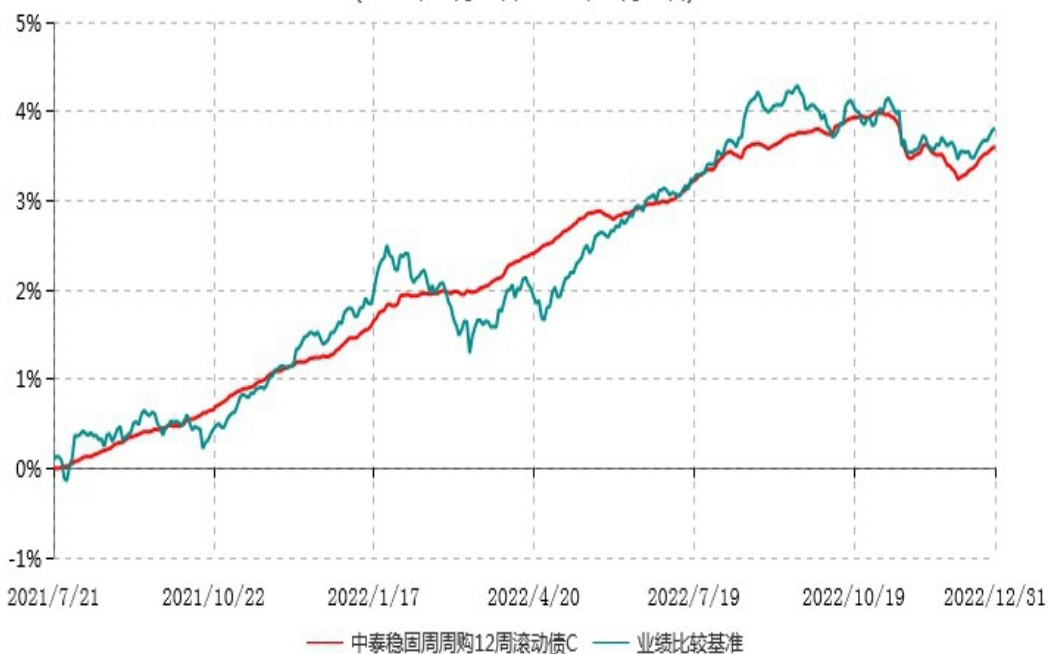
中泰稳固周周购12周滚动债C累计净值增长率与业绩比较基准收益率历史走势对比图 (2021年07月21日-2022年12月31日)

注：根据基金合同约定，本基金自基金合同生效之日起6个月内为建仓期。建仓期结束时，本基金各项资产配置比例符合基金合同约定。