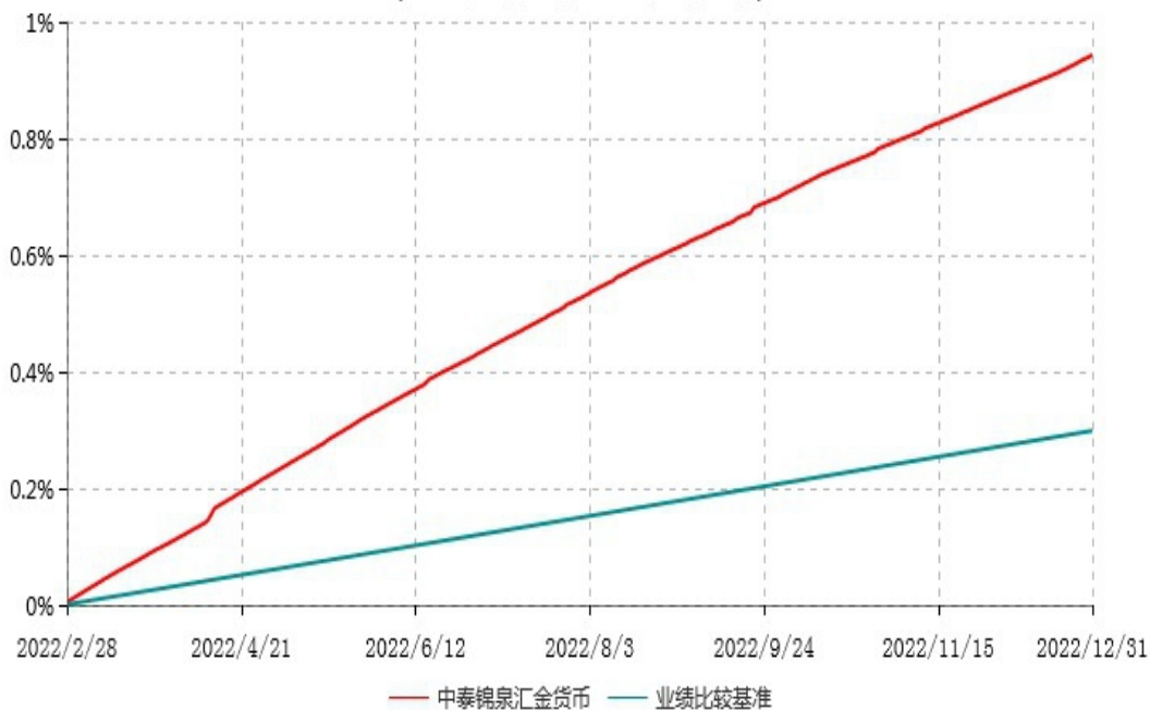
中泰锦泉汇金货币市场基金累计净值收益率与业绩比较基准收益率历史走势对比图 (2022年02月28日-2022年12月31日)