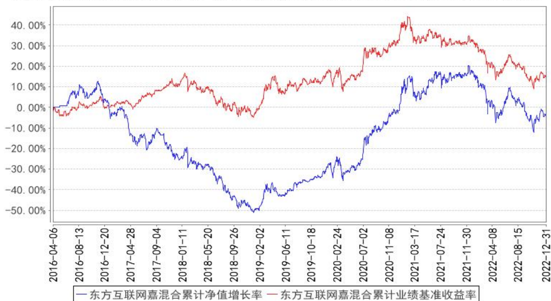
东方互联网嘉混合累计净值增长率与同期业绩比较基准收益率的历史走势对比图