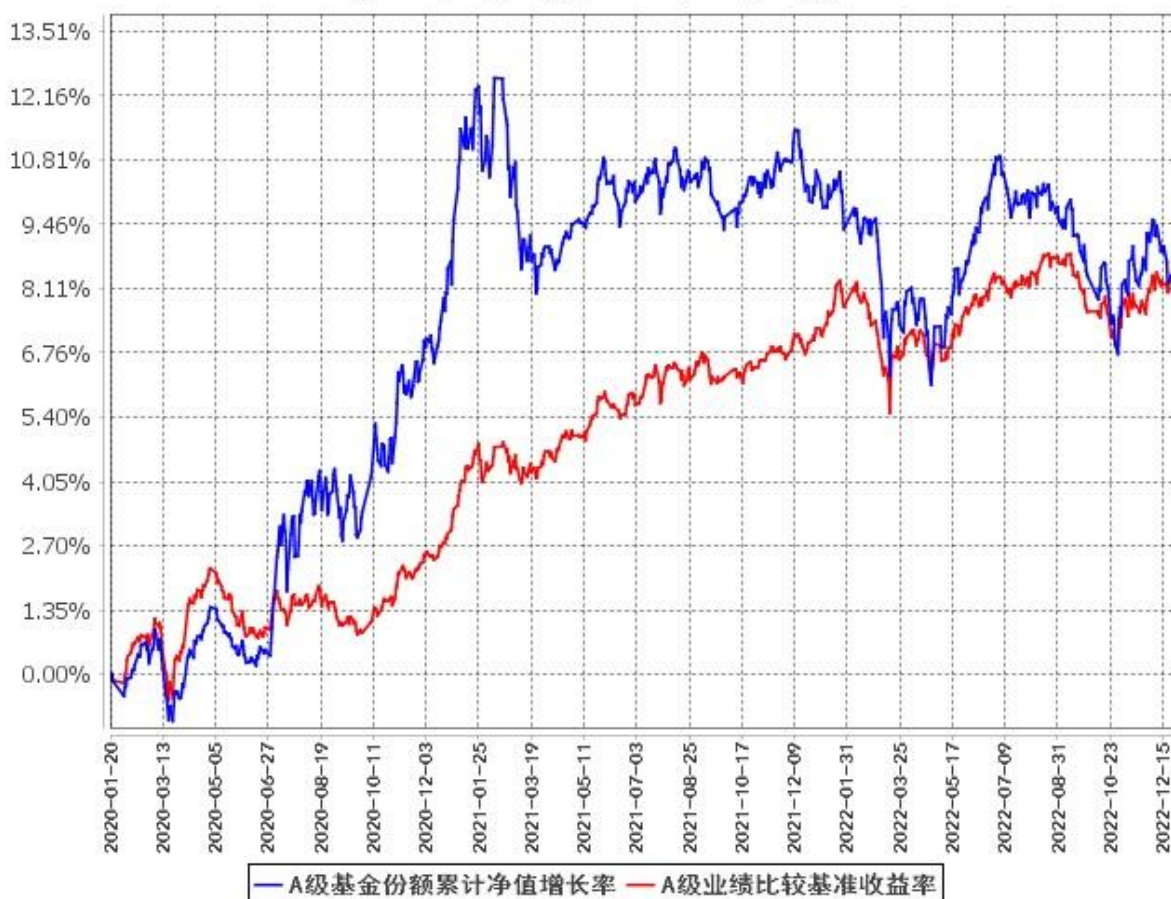
A级基金份额累计净值增长率与同期业绩比较基准收益率的历史走势对比图 (2020年1月20日至2022年12月31日)