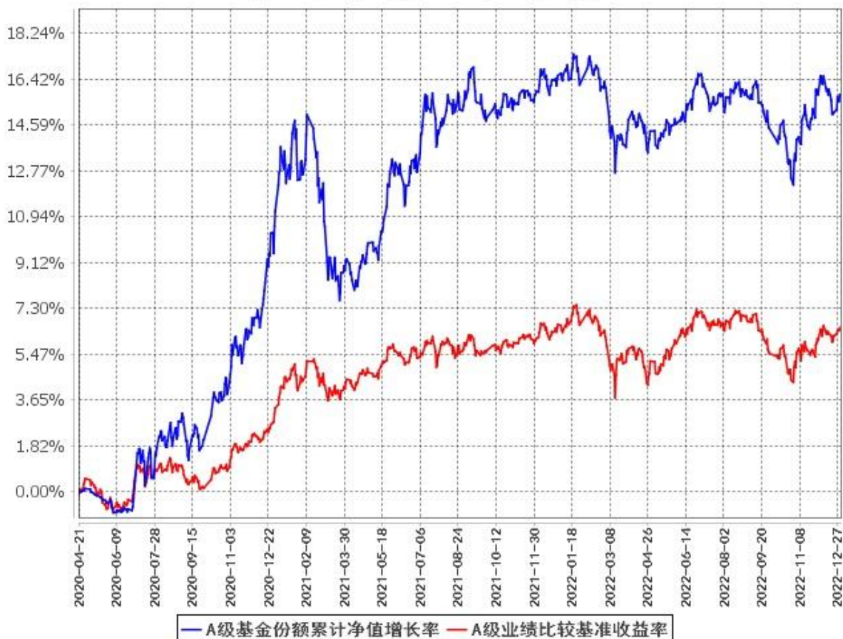
A级基金份额累计净值增长率与同期业绩比较基准收益率的历史走势对比图 (2020年4月21日至2022年12月31日)