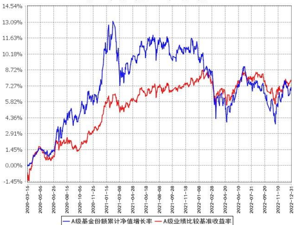
A级基金份额累计净值增长率与同期业绩比较基准收益率的历史走势对比图 (2020年3月16日至2022年12月31日)