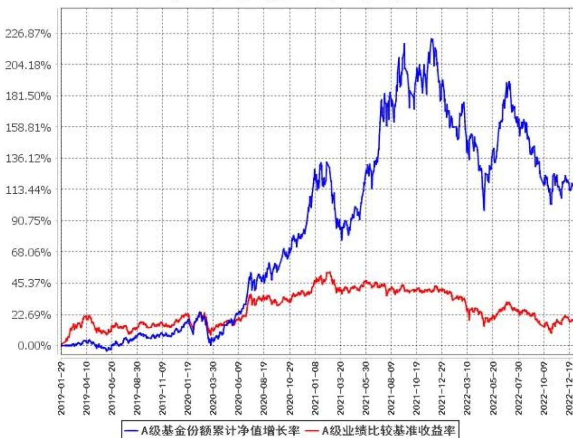
A级基金份额累计净值增长率与同期业绩比较基准收益率的历史走势对比图 (2019年1月29日至2022年12月31日)