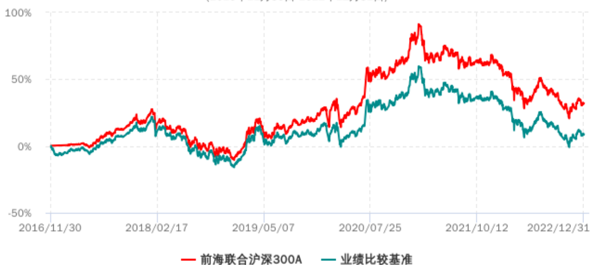
前海联合沪深300C累计净值增长率与业绩比较基准收益率历史走势对比图