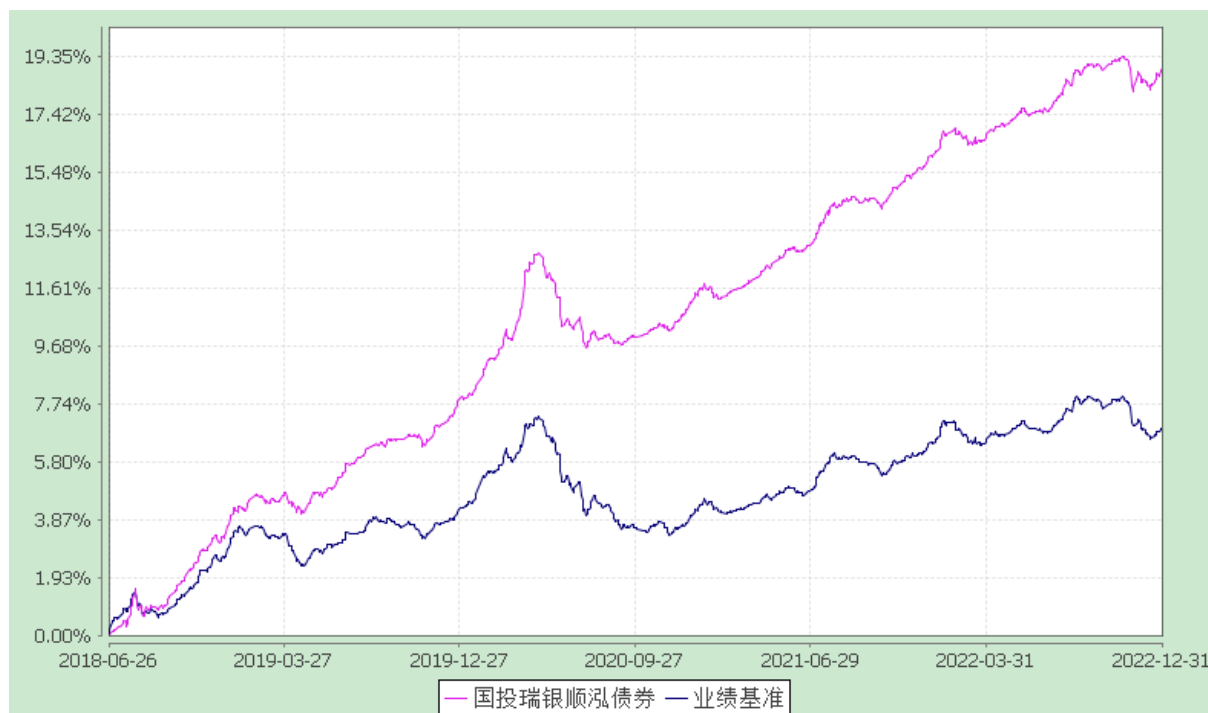
国投瑞银顺泓定期开放债券型证券投资基金 份额累计净值增长率与业绩比较基准收益率的历史走势对比图 (2018年6月26日至2022年12月31日)

注：本基金建仓期为自基金合同生效日起的6个月。截至建仓期结束，本基金各项资产配置比例符合基金合同及招募说明书有关投资比例的约定。