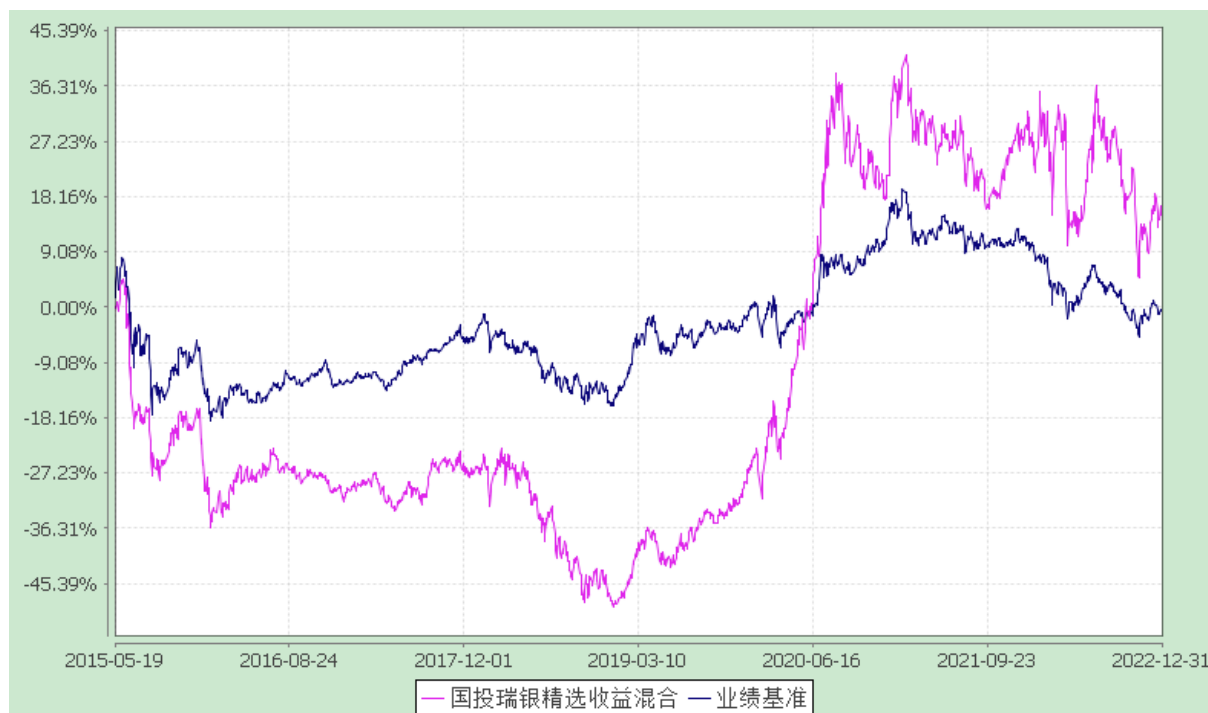
份额累计净值增长率与业绩比较基准收益率的历史走势对比图 (2015 年 5 月 19 日至 2022 年 12 月 31 日)

注：本基金建仓期为自基金合同生效日起的 6 个月。截至建仓期结束，本基金各项资产配置比例符合基金合同及招募说明书有关投资比例的约定。