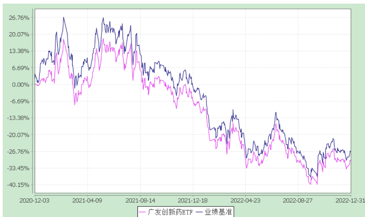
广发中证创新药产业交易型开放式指数证券投资基金 份额累计净值增长率与业绩比较基准收益率的历史走势对比图 (2020 年 12 月 3 日至 2022 年 12 月 31 日)