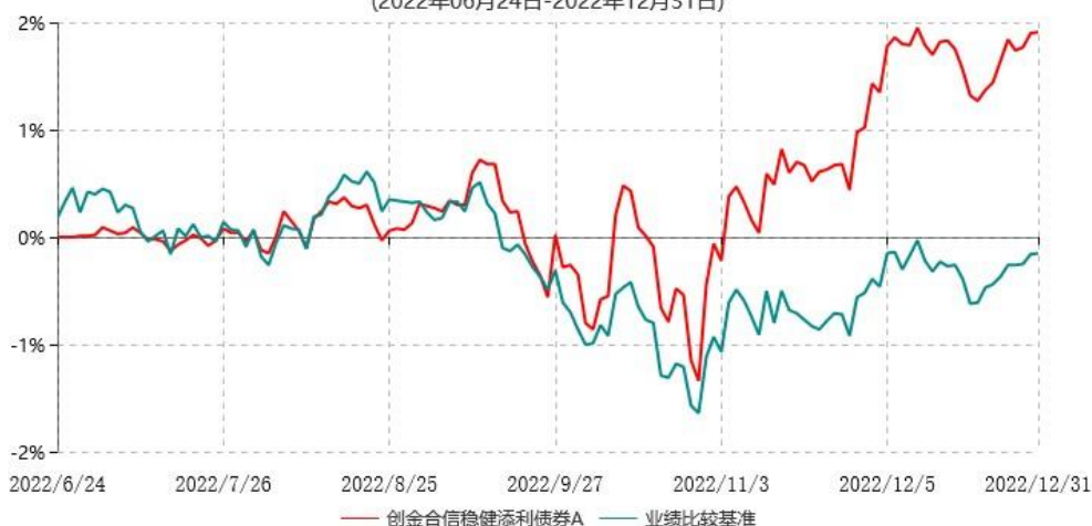
创金合信稳健添利债券 A 累计净值增长率与业绩比较基准收益率历史走势对比图 (2022 年 06 月 24 日-2022 年 12 月 31 日)