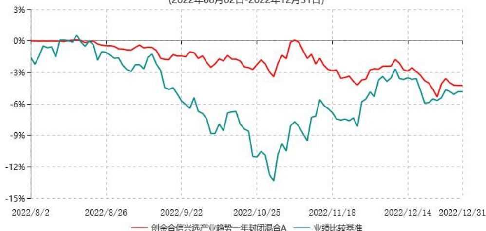
创金合信兴选产业趋势一年封闭混合A累计净值增长率与业绩比较基准收益率历史走势对比图 (2022年08月02日-2022年12月31日)