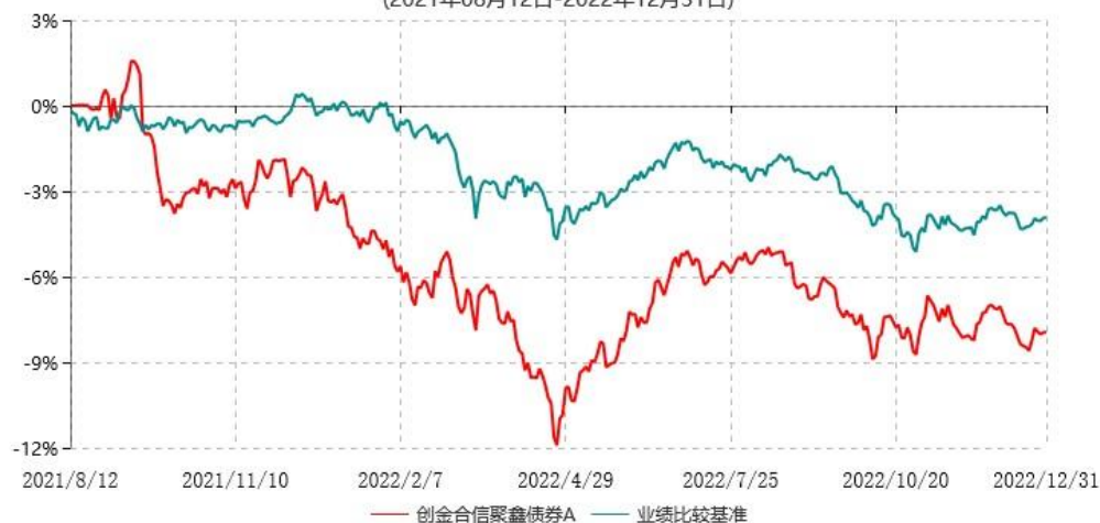
创金合信聚鑫债券A累计净值增长率与业绩比较基准收益率历史走势对比图 (2021年08月12日-2022年12月31日)