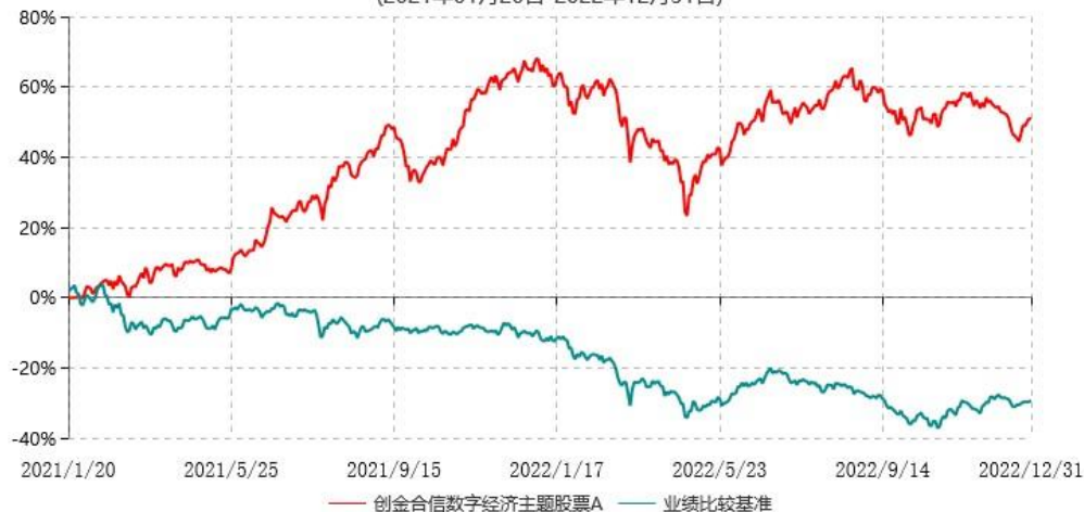
创金合信数字经济主题股票A累计净值增长率与业绩比较基准收益率历史走势对比图 (2021年01月20日-2022年12月31日)