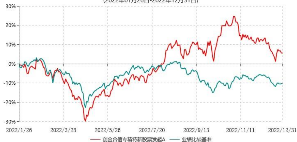
创金合信专精特新股票发起A累计净值增长率与业绩比较基准收益率历史走势对比图 (2022年01月26日-2022年12月31日)