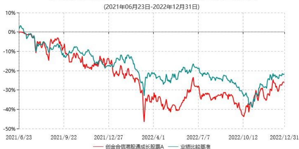
创金合信港股通成长股票A累计净值增长率与业绩比较基准收益率历史走势对比图