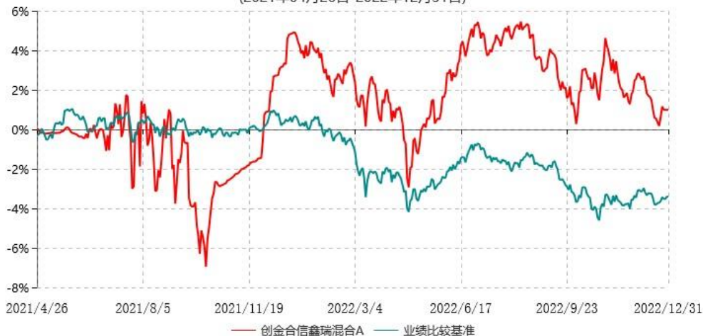
创金合信鑫瑞混合A累计净值增长率与业绩比较基准收益率历史走势对比图 (2021年04月26日-2022年12月31日)