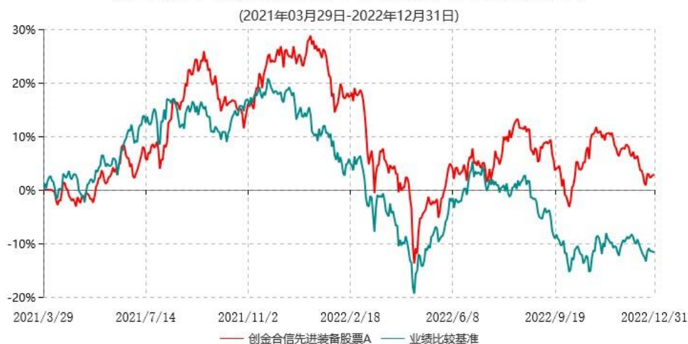
创金合信先进装备股票A累计净值增长率与业绩比较基准收益率历史走势对比图