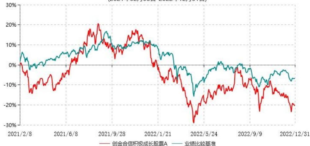
创金合信积极成长股票A累计净值增长率与业绩比较基准收益率历史走势对比图 (2021年02月08日-2022年12月31日)