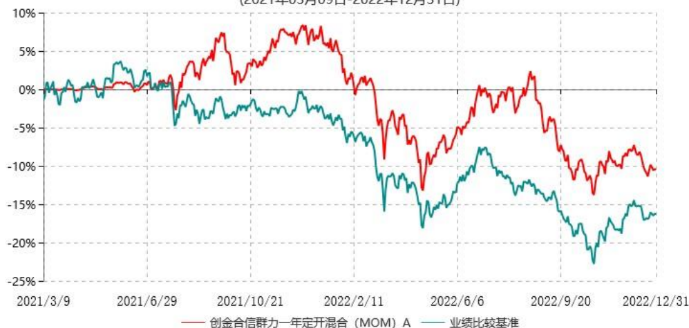
创金合信群力一年定开混合（MOM）A 累计净值增长率与业绩比较基准收益率历史走势对比图 (2021年03月09日-2022年12月31日)