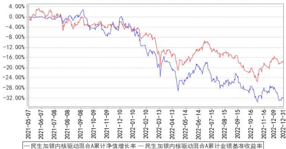
民生加银内核驱动混合A 累计净值增长率与同期业绩比较基准收益率的历史走势对比图