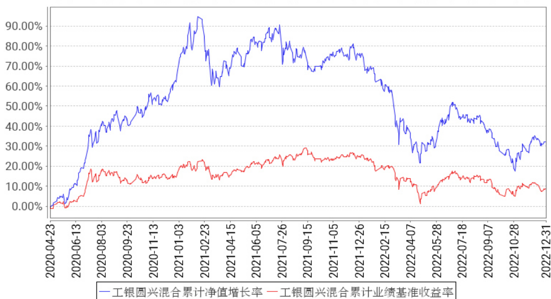
工银圆兴混合累计净值增长率与同期业绩比较基准收益率的历史走势对比图