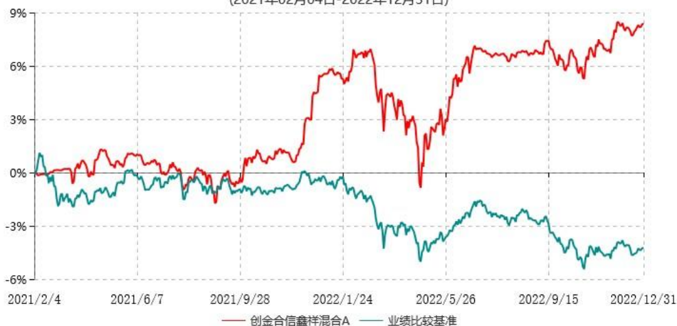
创金合信鑫祥混合A累计净值增长率与业绩比较基准收益率历史走势对比图 (2021年02月04日-2022年12月31日)