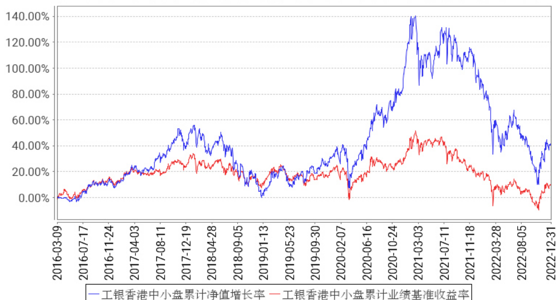
工银香港中小盘累计净值增长率与同期业绩比较基准收益率的历史走势对比图