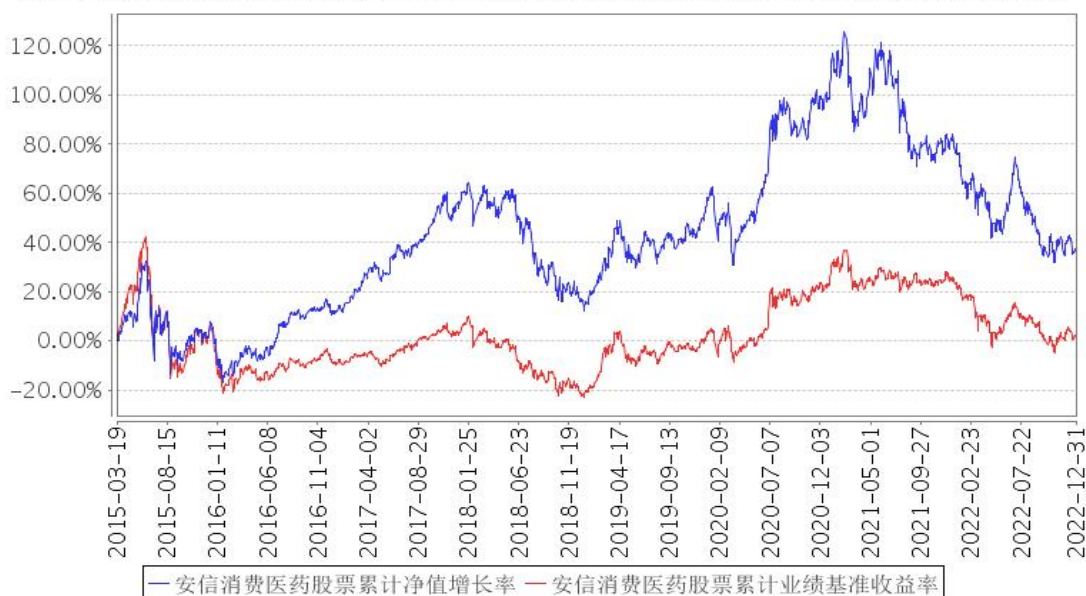
安信消费医药股票累计净值增长率与同期业绩比较基准收益率的历史走势对比图