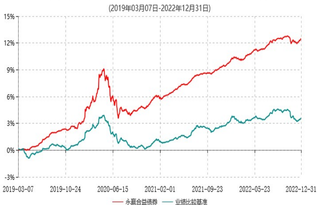
永赢合益债券型证券投资基金累计净值增长率与业绩比较基准收益率历史走势对比图