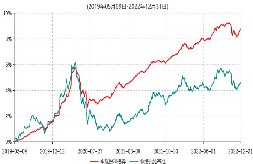
永赢悦利债券型证券投资基金累计净值增长率与业绩比较基准收益率历史走势对比图