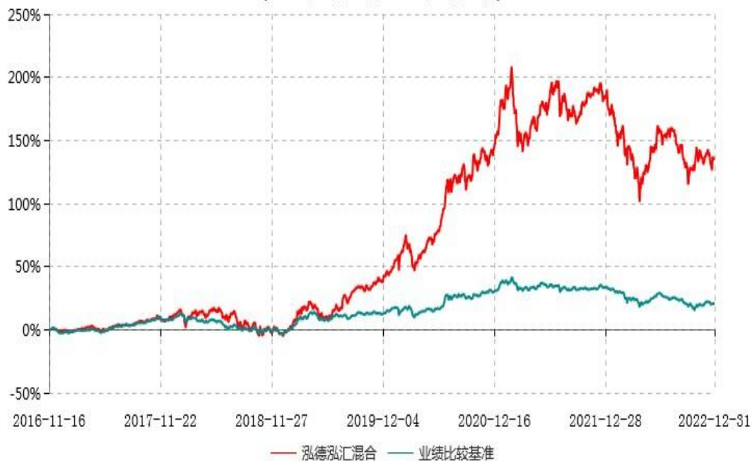
泓德泓汇灵活配置混合型证券投资基金累计净值增长率与业绩比较基准收益率历史走势对比图 (2016年11月16日-2022年12月31日)

注：根据基金合同的约定，本基金建仓期为6个月，截至报告期末，本基金的各项投资比例符合基金合同关于投资范围及投资限制规定。