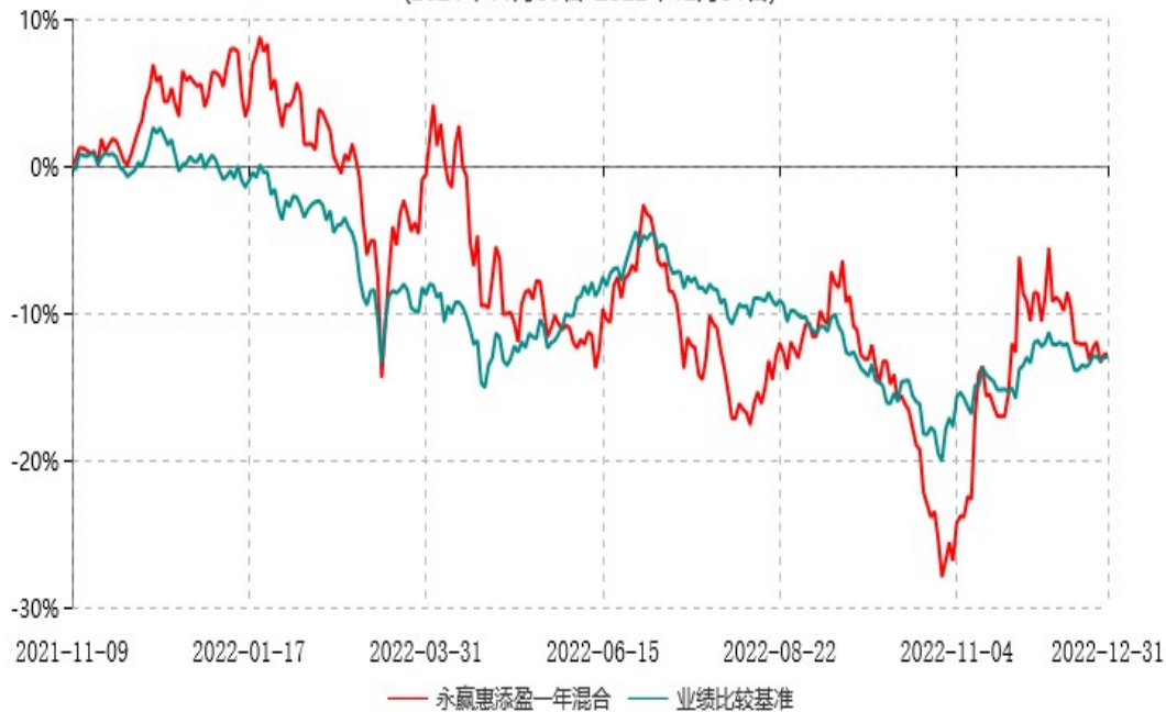
永赢惠添盈一年持有期混合型证券投资基金累计净值增长率与业绩比较基准收益率历史走势对比图 (2021年11月09日-2022年12月31日)