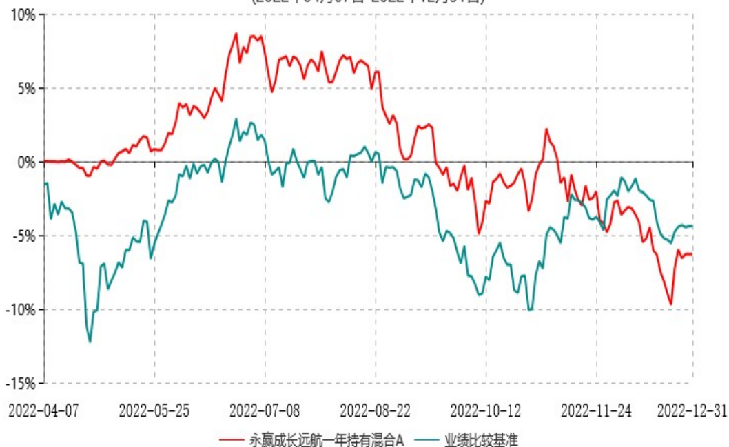
永赢成长远航一年持有混合A累计净值增长率与业绩比较基准收益率历史走势对比图 (2022年04月07日-2022年12月31日)