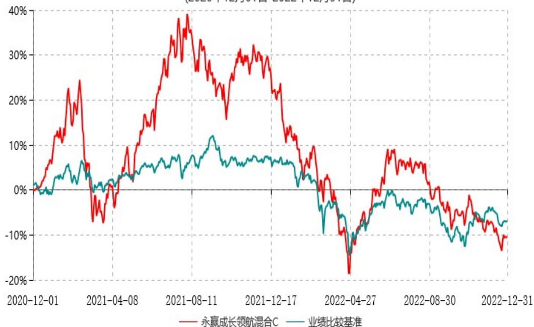
永赢成长领航混合C累计净值增长率与业绩比较基准收益率历史走势对比图 (2020年12月01日-2022年12月31日)